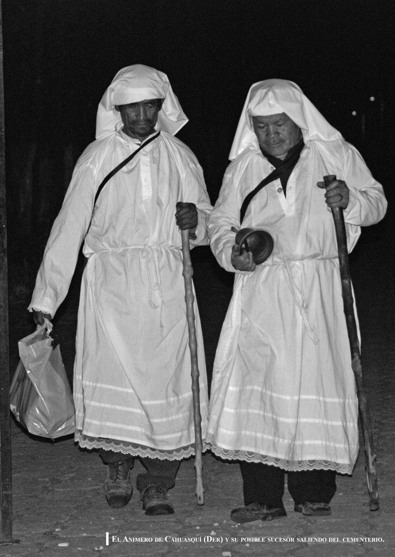
EL ANIMERO DE CAHUASQÍ (DER) Y SU POSIBLE SUCESOR SALIENDO DEL CEMENTERIO.