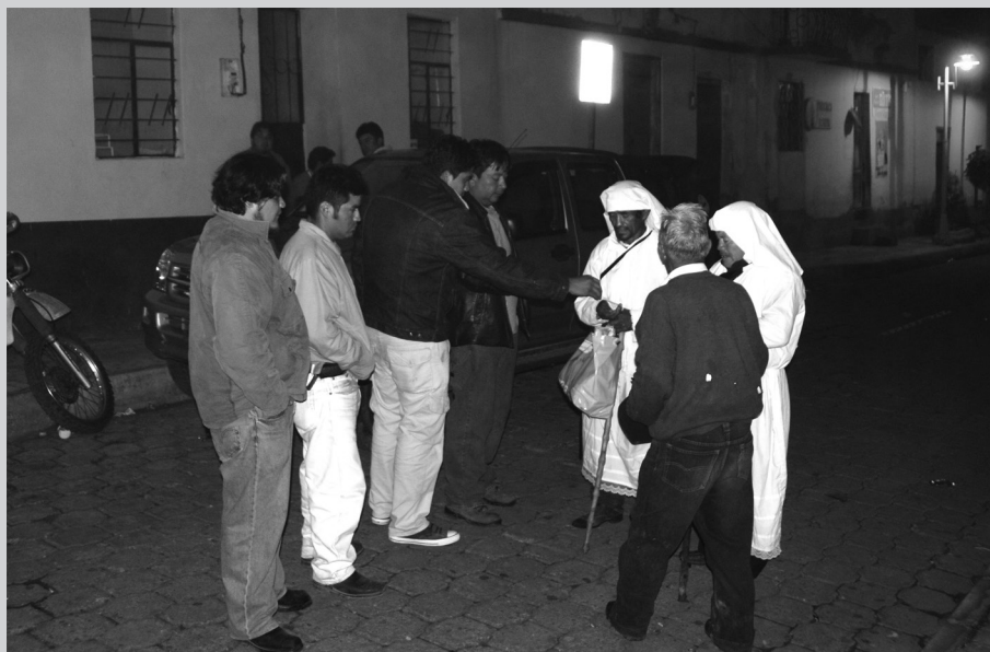
LOS MORADORES DE CAHUASQUÍ, SOLICITANDO REZOS PARA SUS FAMILIARES DIFUNTOS.